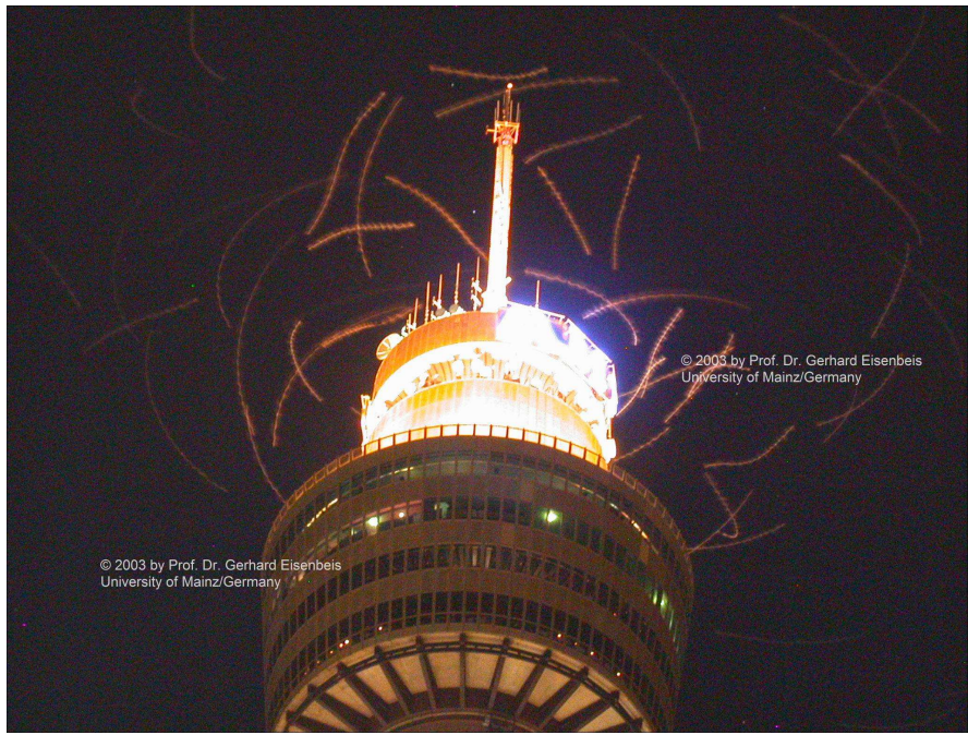
Les oiseaux sont attirés par les grands immeubles illuminés, d'où un risque de collision élevé. Selon les estimations des scientifiques, ce sont chaque année, pour la seule Amérique du Nord, entre cent millions et un milliard d'oiseaux migrateurs qui viennent s'écraser de nuit contre des immeubles illuminés.