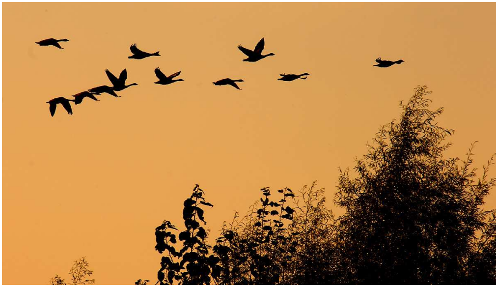
Les oiseaux migrateurs s'orientent notamment grâce aux étoiles. La lumière artificielle change radicalement leur situation. Quand la visibilité est mauvaise, ils sont attirés par des sources lumineuses ponctuelles et par les halos lumineux au-dessus des grandes villes, et dévient de leur trajectoire. Leur voyage s'en trouve inutilement – et dangereusement – rallongé.