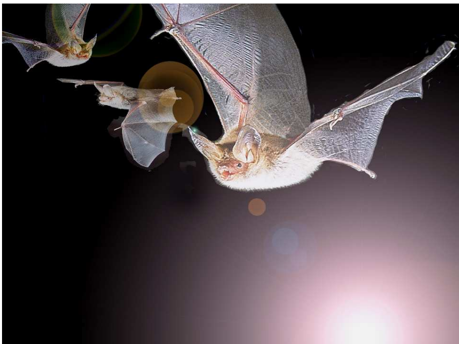
Les chauves-souris sont «chassées» de leur habitat : l'éclairage des entrées/sorties des gîtes (clochers, charpentes, bâtiments, falaises, cavités...) les fait disparaître.