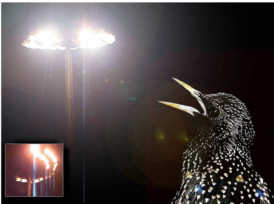
Quelques espèces profitent de l'éclairage pour développer (sur-développer) leurs effectifs (étourneau, moineau, mésange charbonnière, pigeons urbains...).