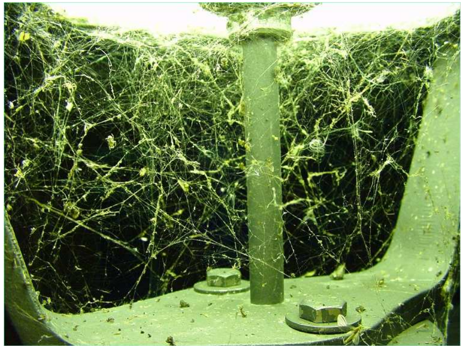
Les insectes et les papillons de nuit sont attirés par les infrarouges et les ultraviolets des lampes. Ils viennent griller vifs sur les luminaires ou constituent des proies faciles pour les prédateurs.